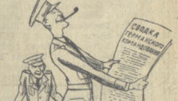
И уже послышались слова: «Внимай! Говорит Москва! Седьмого в ночь район Берлина Бомбили отряд наш боевой, И все советские машины Вернулись в целости домой.»