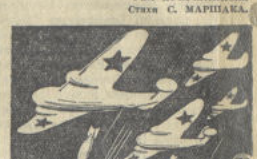
Седьмого несколько машин Бомбили с воздуха Берлин.

ЛОНДОН, 9 августа. (ТАСС). Агентство Гейблер передает следующие сообщения английскому министерству авиации: